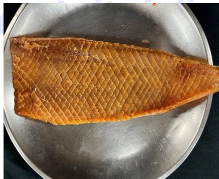
魷魚交叉切割參考圖案